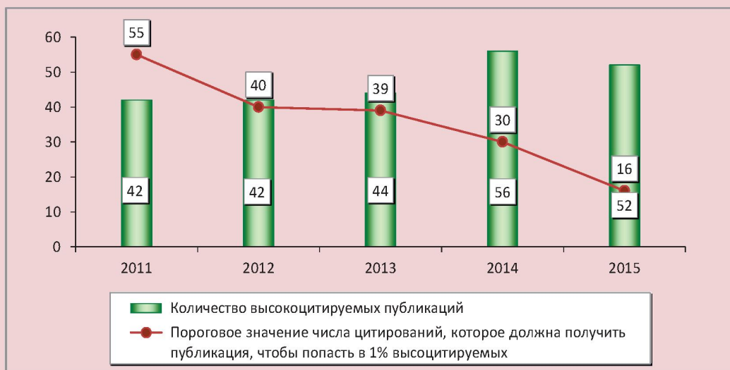
Рисунок 4. Распределение высокоцитируемых публикаций экономических институтов РАН за период 2011–2015 гг. (данные НЭБ на 11.11.2016)

Применение описанной методики позволило выделить 236 высокоцитируемых публикаций экономических институтов РАН за период 2011–2015 гг. На рисунке 4 представлены данные о числе таких публикаций за каждый год обозначенного периода. Здесь же приведены пороговые значения числа цитирований,