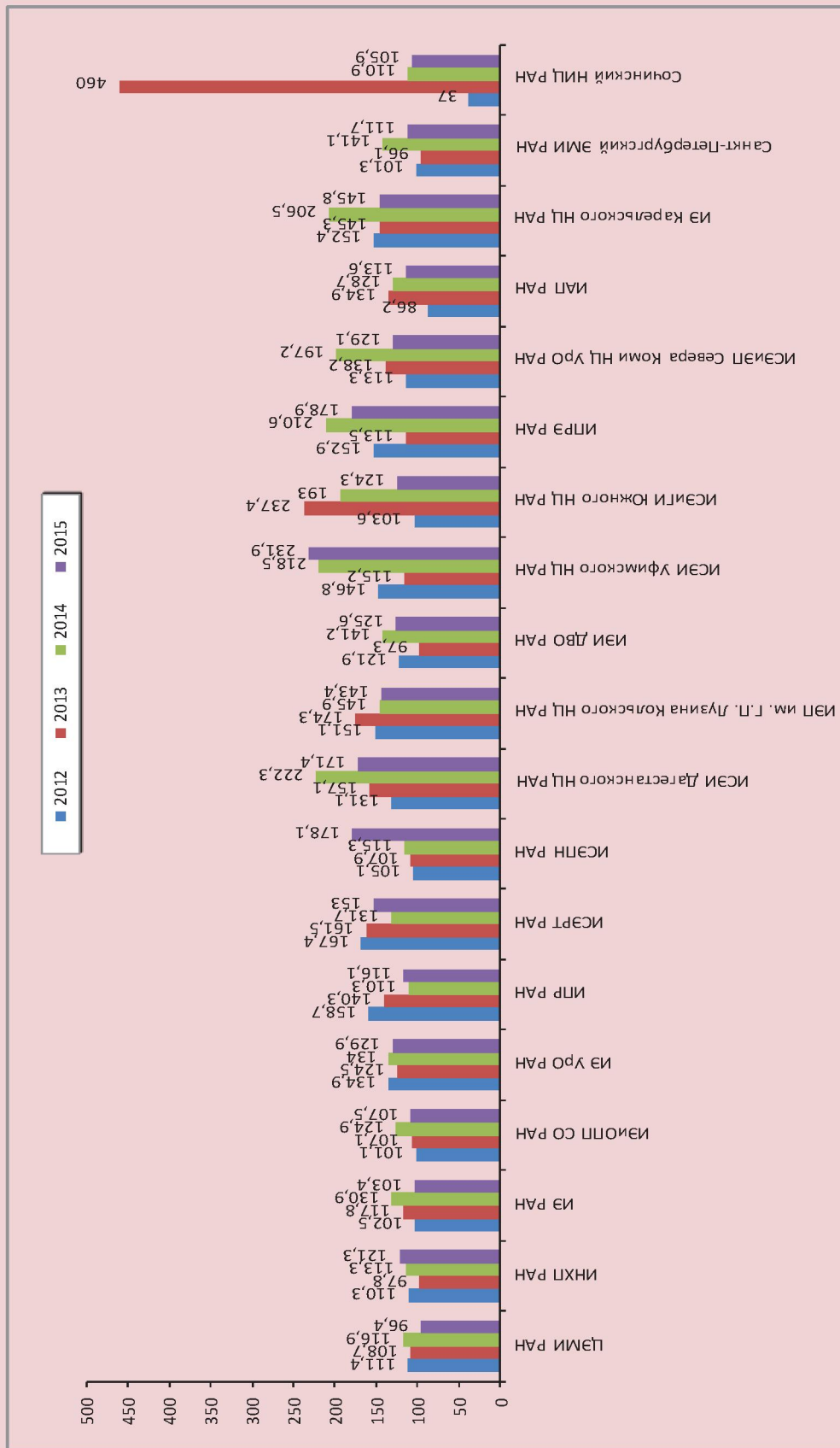
Рисунок 2. Темпы роста числа цитирований экономических институтов РАН в Российском индексе научного цитирования, % (данные НЭБ на 11.11.2016)