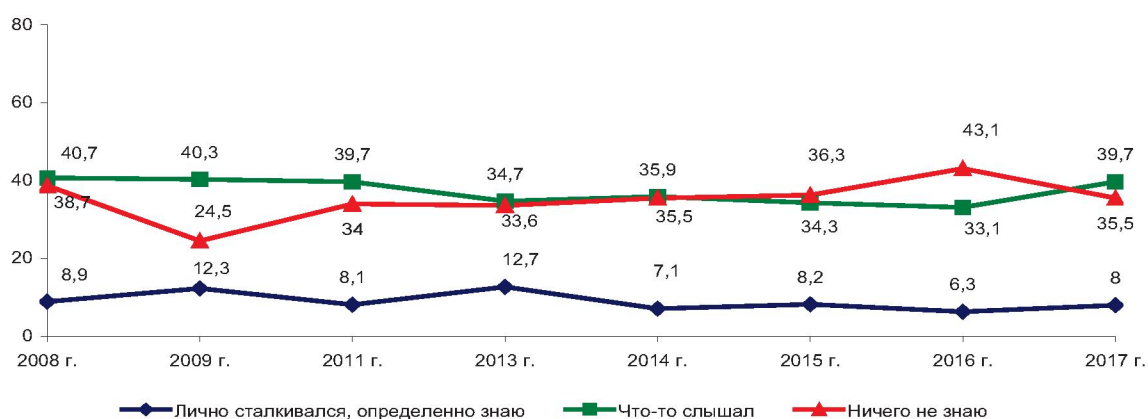
Рис. 42. Знаете ли Вы о деятельности в Вологодской области некоммерческих (общественных) организаций (регионального отделения партий, профсоюзов, религиозных, правозащитных, благотворительных организаций, обществ и т.д.)? (в % от числа опрошенных)*