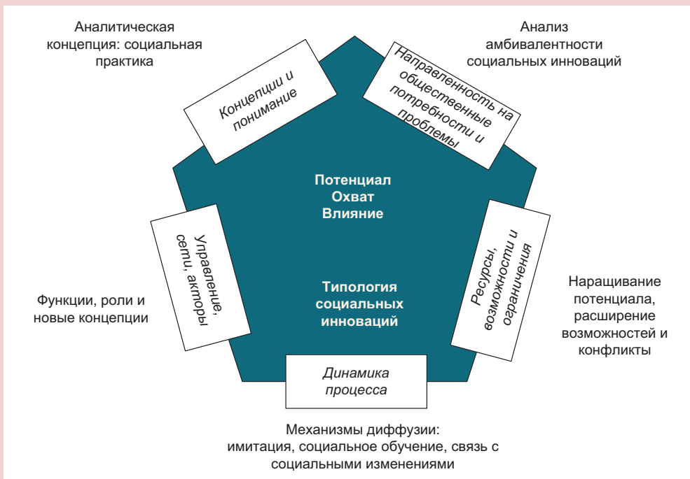
Рисунок 2. Пять ключевых измерений SI-DRIVE