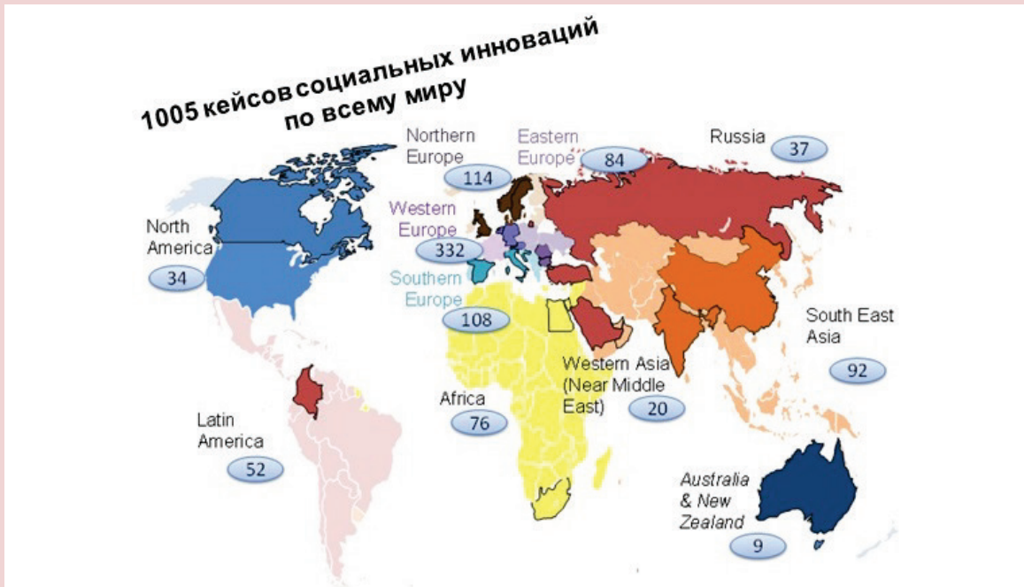
Рисунок 1. Количество проектов, принимающих участие в SI-DRIVE