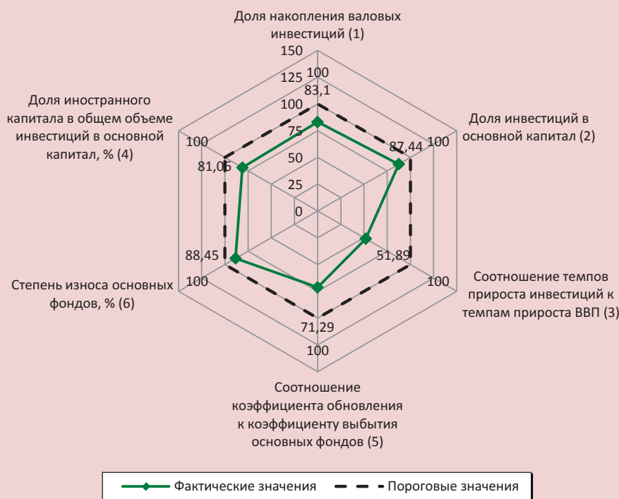
Рис. 4. Оценка остроты кризисной ситуации в инвестиционной сфере РФ (расчеты авторов)

Необходимость активизации и интенсификации инвестиционной деятельности в экономике России для улучшения ее состояния и преодоления автономной рецессии также подтверждается результатами проведенного нами индикативного анализа уровня инвестиционной безопасности. Для визуализации результатов использована лепестковая диаграмма, содержащая нормированные индикаторы инвестиционной безопасности РФ в 2015 г. (рис. 4). Наибольшее опасение вызывают индикаторы «Соотношение коэффициента об-