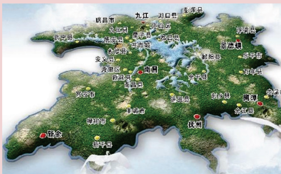
Рис. 1. Расположение эколого-экономической зоны озера Поянху

Как отмечалось выше, многие отечественные и зарубежные ученые дают определение понятиям «экологический капитал» и «управление экологическим капиталом». Авторы настоящей статьи придерживаются следующего определения: экологический капитал включает в себя экологические ресурсы и экологическую среду, которые могут принести экономические и социальные выгоды, такие как повышение качества окружающей среды, способность к самоочищению, экологический потенциал для производства полезной ценности для будущего, качество экологической среды и общую ценность использования экологической системы на данной территории. Управление экологическим капиталом в эколого-экономической зоне озера Поянху, опирающееся на экологические ресурсы, направлено на обеспечение непрерывной циркуляции и накопления экологического капитала в процессе эксплуатации и оценки экологических ресурсов посредством государственной поддержки и рыночного регулирова-