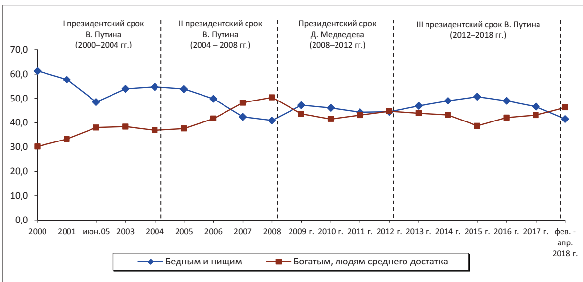
Рис. 2. Динамика социальной самоидентификации населения (формулировка вопроса: «К какой категории Вы себя относите?», в % от числа опрошенных)