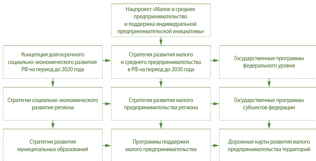
Рис. Взаимосвязь нормативно-правовых документов, регламентирующих стратегическое планирование развития малого предпринимательства

Анализ существующей нормативной базы органов региональной власти субъектов РФ позволил выявить только пять отдельных стратегий, регламентирующих поддержку исследуемого сектора экономики (Алтайский край, республики Башкортостан, Саха и Чувашская, а также Ярославская область). В остальных регионах данный нормативный документ отсутствует или заменяется общей стратегией социально-экономического развития территории. Также стоит отметить, что принятые стратегии на региональном уровне различаются между собой по содержанию и направлениям развития данного сектора экономики. Поэтому выработка методических рекомендаций