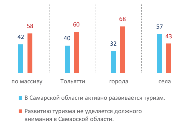
Рис. 1. Выбор респондентами суждений о развитии туризма, % по столбцам

В анкете респондентам были предложены суждения об условиях жизни в Самарском регионе. Одна из пар противоположных суждений имела отношение к туризму. Суждение «в Самарской области активно развивается туризм» нашло поддержку у 42% участников опроса. 58% респондентов выразили согласие с суждением «развитию туризма не уделяется должного внимания в Самарской области» (рис. 1).