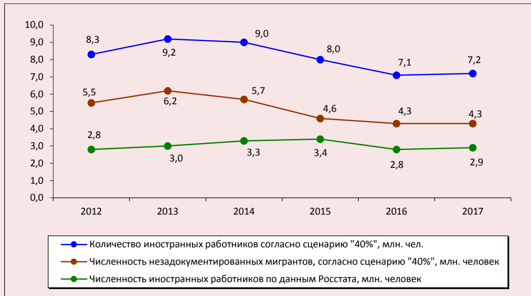
Рис. 2. Динамика оценочной общей численности иностранных работников на российском рынке труда