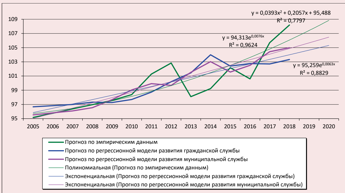
Рис. 2. Динамика и прогноз индекса СЭР субъекта РФ

3. Велика взаимосвязь процессов развития федеральной и региональной госслужбы (0,76). Эти процессы протекают сопряжённо. Линейные регрессионные модели, построенные по индексам развития гражданской и муниципальной службы, позволяют спрогнозировать динамику индекса СЭР субъекта РФ (рис. 2).