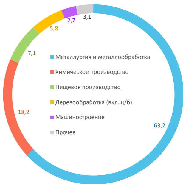
Рис. 3. Структура обрабатывающих производств Вологодской области в 2018 году, % к итогу

целлюлозно-бумажной отрасли – с 13 до 6%, легкой промышленности – с 8 до 1%. На две ведущие отрасли в 1998 году приходилось 75% отгрузки обрабатывающей промышленности региона (для справки – к 2018 году их удельный вес вырос до 81%; рис. 3 ).