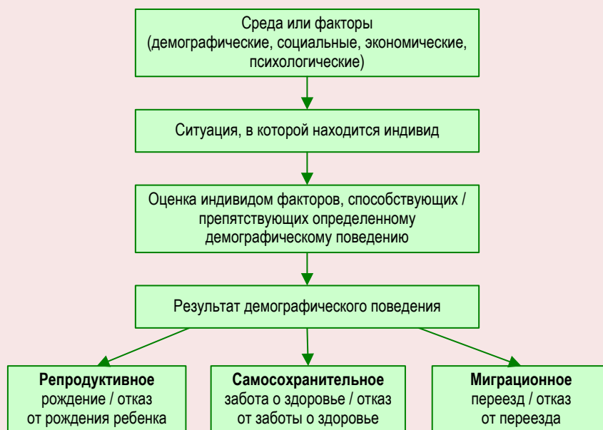
Рис. 2. Схема принятия решения об акте демографического поведения