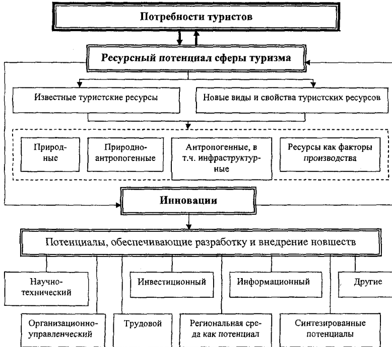
Рис.1. Ресурсное обеспечение устойчивого развития туризма

Для устойчивого развития туризма в первую очередь необходимы ресурсы, позволяющие удовлетворять постоянно меняющиеся физические и духовные потребности туристов (рис. 1), рациональное использование которых должно осуществляться через механизм экономики региона.