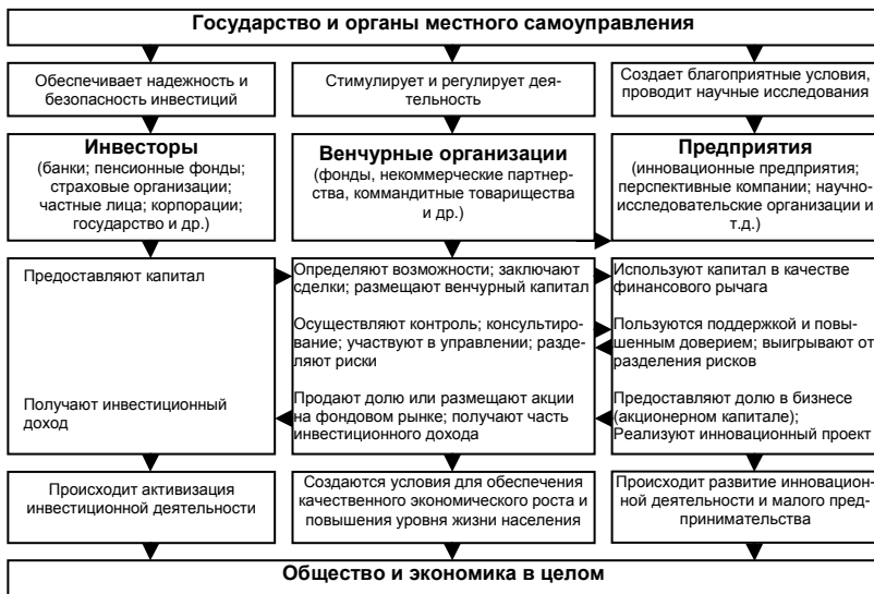
Рис. 1. Основные субъекты процесса венчурного инвестирования и их взаимодействие

Основные субъекты процесса венчурного инвестирования и их взаимоотношения представлены на рис. 1.