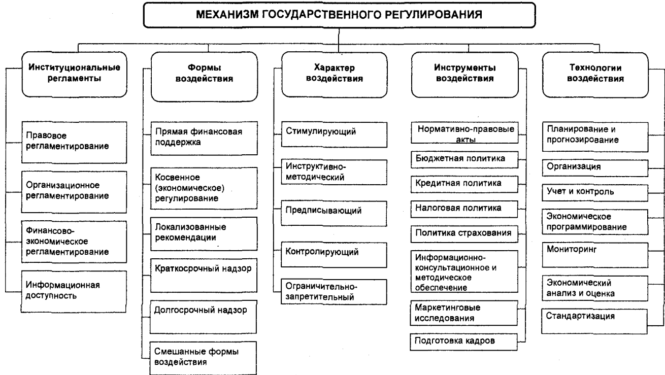
Рис.3. Системно-структурная модель механизма государственного регулирования развития сельской кредитной кооперации