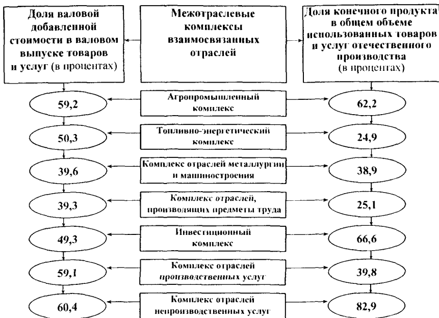
Рис.1. Агропромышленный комплекс в системе межотраслевых комплексов экономики России

Доля валовой добавленной стоимости в общем выпуске товаров и услуг агропромышленного комплекса составляет 59,2 процента, то есть выше, чем в топливно-энергетическом комплексе (50,3 процента), комплексе отраслей, производящих предметы труда (39,3 процента), комплексе отраслей металлургии и машиностроения (39,6 процента). Приоритетное развитие агропромышленного комплекса является мультипликатором экономического роста, обеспечивает ускорение темпов роста валового внутреннего продукта страны и его составляющих (фонда оплаты труда, валовой прибыли, валового смешанного дохода и др.).