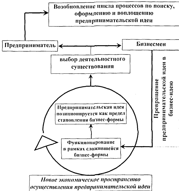
Рис. 2 Схематическое отображение модели социально-экономического осуществления предпринимательской идеи (возобновление функционирования)