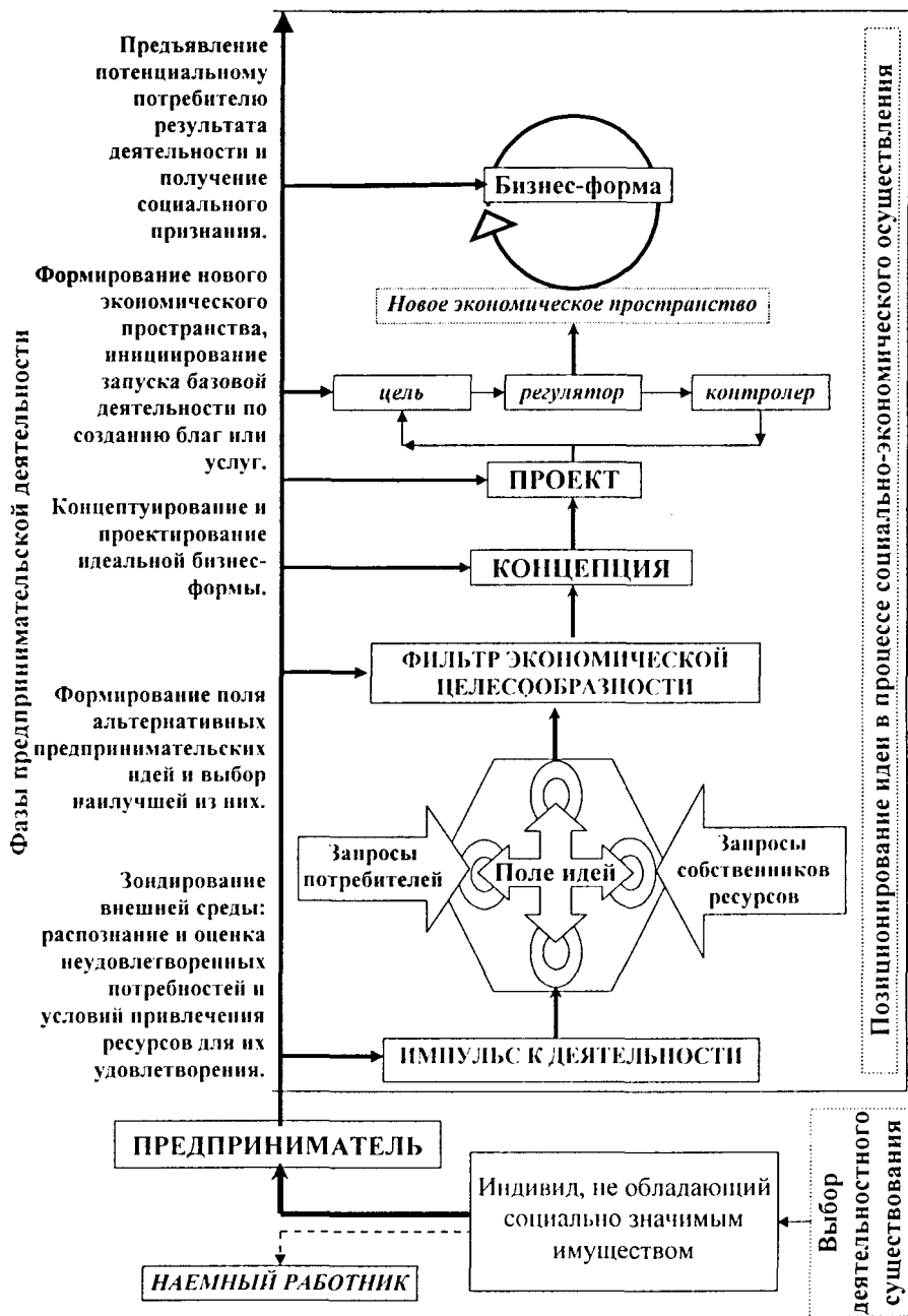
Рис. 1 Схематическое отображение модели социально-экономического осуществления предпринимательской идеи (единичный акт)