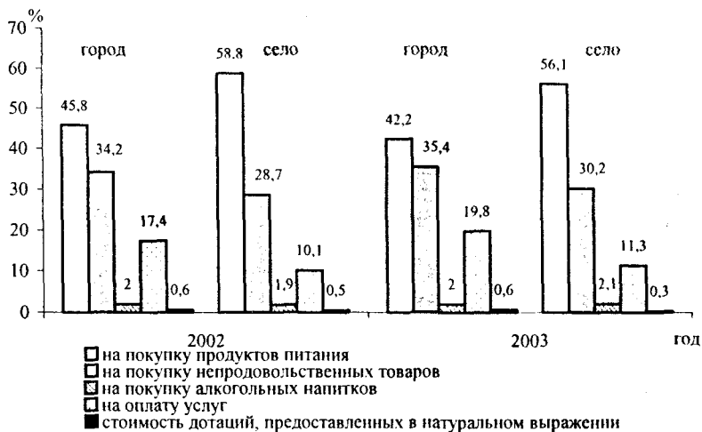
Рис.3. Доля затрат на питание в структуре расходов на конечное потребление в городских и сельских домашних хозяйствах России в 2002-2003 гг. (в %)

нах с развитой рыночной экономикой. В Саратовской области эта доля составляла в 2003 году более 50 процентов общего уровня денежных расходов домашних хозяйств горожан и почти половину расходов сельских домашних хозяйств (рис. 3.).