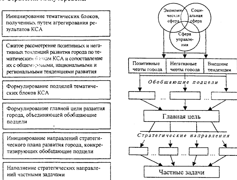
Рис. 3. Алгоритм агрегирования результатов комплексного стартового анализа для выбора главной цели, направлений и задач стратегического плана развития города.

позволяющая сопоставить каждое предложенное направление стратегического развития города с параметрами благосостояния граждан. Заполненные экспертным образом строки матрицы характеризуют степень влияния реализации мероприятий каждого стратегического направления на изменение параметров благосостояния граждан. Далее заполненная матрица преобразуется путем попеременной перестановки строк и столбцов от максимальной (max) суммы пересечений строк и столбцов к минимальной (min) сумме пересечений. В результате в модифицированной матрице строки характеризуют степень направленности частных целей стратегического плана на конечные социальные результаты, а столбцы, в свою очередь, ранжированы слева направо в зависимости от степени ориентации стратегического плана на тот или иной конечный ориентир. Если разброс отмеченных экспертами оценок не обладает достаточным охватом ячеек, то необходимо либо пересмотреть частные цели Стратегического плана, либо по-новому оценить систему социальных предпочтений общества. Использование этого методического приема осуществлено в п.3.3 диссертации на примере Стратегии г.Ялуторовска.