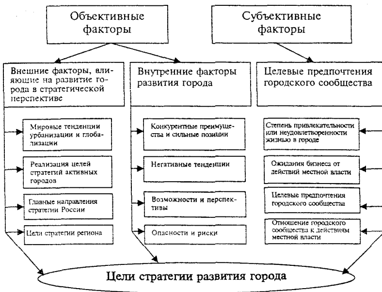
Рис.2. Система факторов, влияющих на определение целей стратегического плана развития города.

Внутренние факторы целеполагания — это те объективные характеристики, которые изнутри обуславливают цели стратегического плана городского развития и определяют специфику целеполагания, присущую конкретному городу: