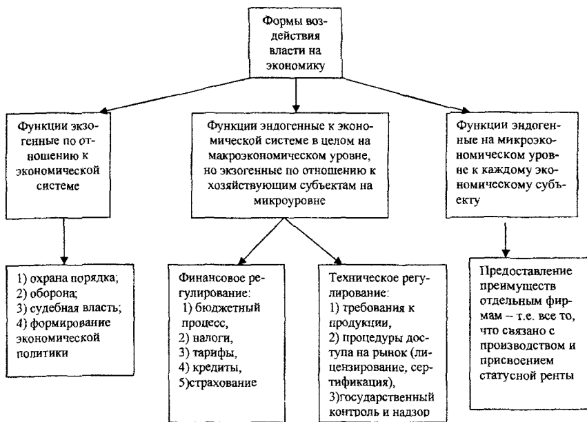
Рис. 1. Формы воздействия власти на экономику.

По мнению автора, именно техническое регулирование, а также проявление властного ресурса на микроэкономическом уровне, связанное с предоставлением преимуществ отдельным фирмам, расширяют пространство для применения властного ресурса, возникновения статусной ренты и коррупции.