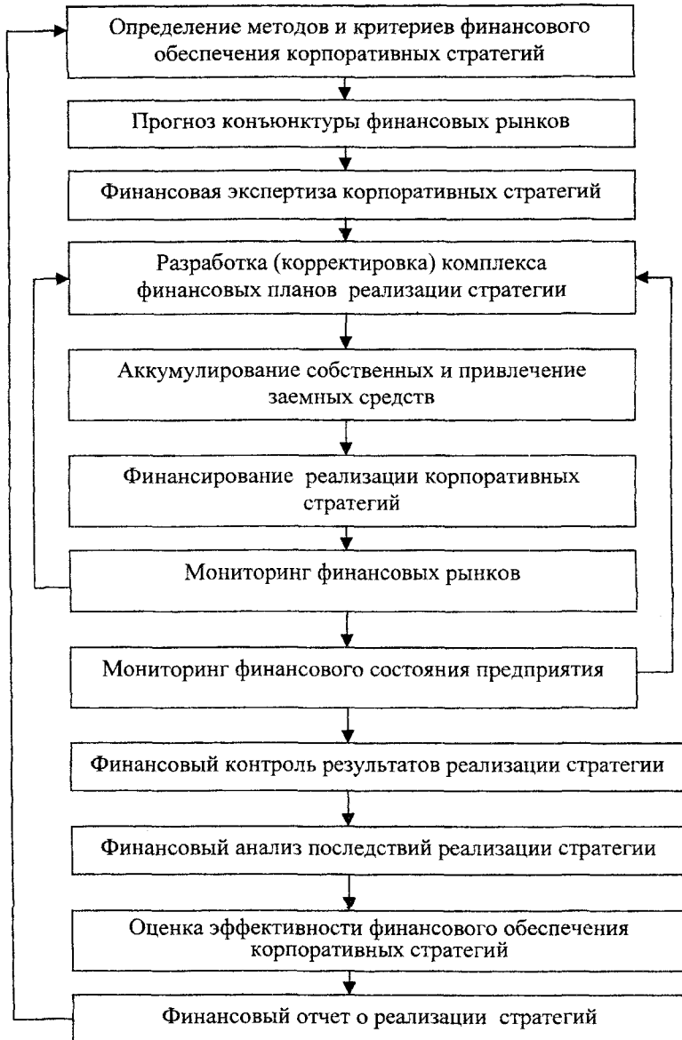
Рис. 1. Алгоритм финансового обеспечения корпоративных стратегий