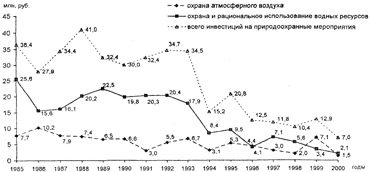
Рис.2. Инвестиции на охрану окружающей среды и рациональное использование природных ресурсов на территории Вологодской области за 1985-2000 годы в ценах 1990 г., млн. руб.