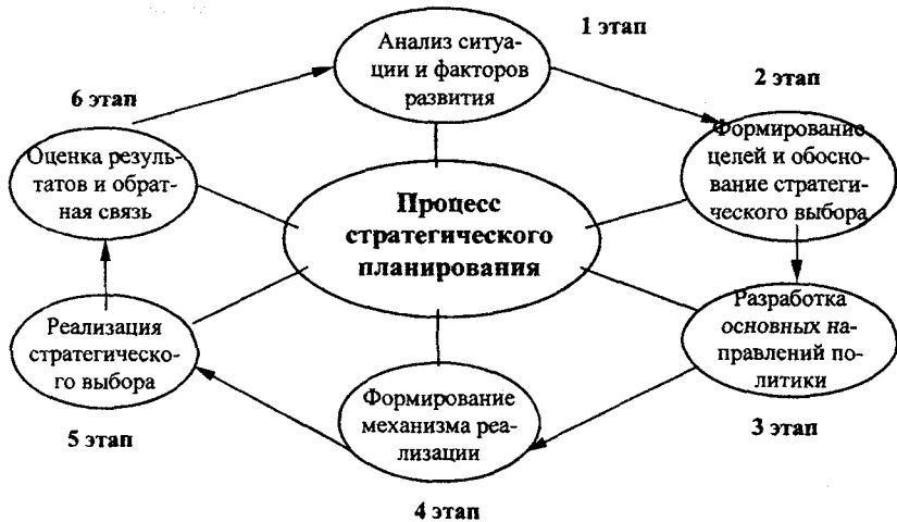
Рис. 1 Этапы процесса стратегического планирования

В работе развиваются организационные основы формирования системы стратегического регионального планирования в соответствии с вышеназванными концептуальными аспектами. Нами также исследованы практические аспекты организации процесса стратегического планирования на региональном уровне: участники процесса разработки и целесообразное разделение функций между ними на разных этапах, схемы разработки, условия успешной разработки и т.д. Последовательность действий в региональном стратегическом планировании включает следующие аналитические и управленческие этапы (рис. 1).