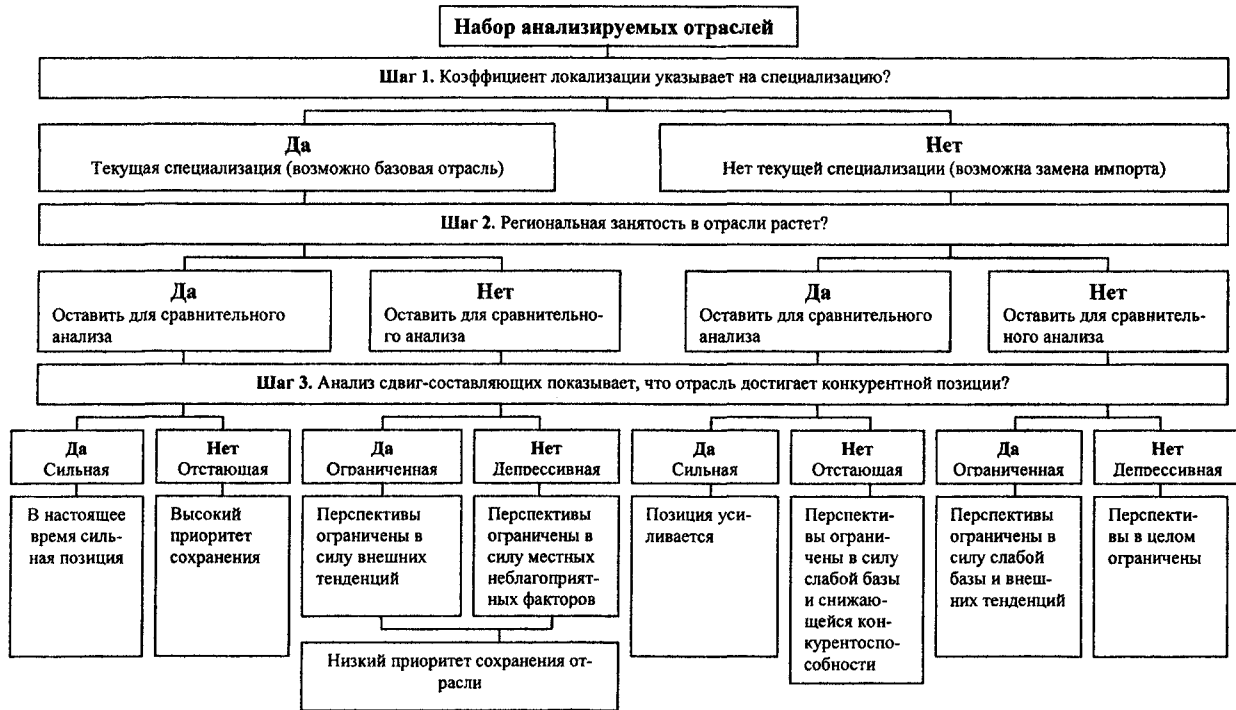
Рис. 2 Алгоритм перспективности отраслей региональной экономики