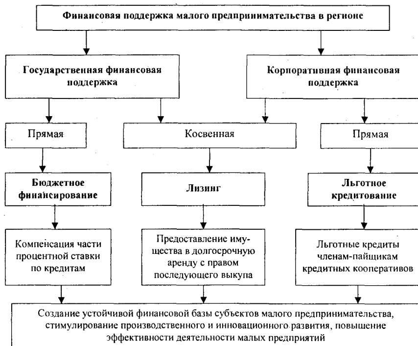
Рис. 2. Формы, виды и методы финансовой поддержки малого предпринимательства в регионе

невозможность их получения в кредитных и других структурах. Исходя из решения этой проблемы, в работе обосновываются инструменты и методы финансовой поддержки малого предпринимательства. Существующий в республике механизм финансовой поддержки малого предпринимательства, как показала практика последних лет, не выполняет своей главной задачи – обеспечение достаточного уровня финансовых ресурсов малых предприятий, необходимого для бесперебойного и прибыльного производства.