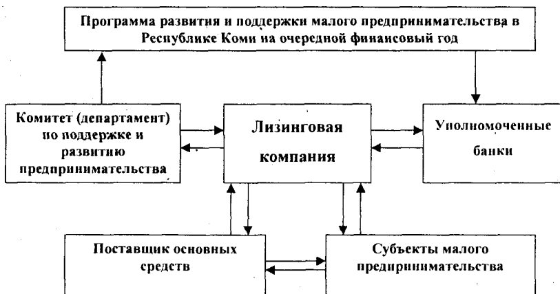
Рис. 3. Схема лизинговой сделки при компенсации банку льготной кредитной ставки по кредиту, взятому лизинговой компанией на приобретение основных средств для субъекта малого бизнеса

она изначально создается для работы с малым предпринимательством, ее собственником будут государственные структуры, а капитал компании представляет собой своеобразный гарантийный фонд, созданный для финансово-имущественной поддержки малого предпринимательства в республике (рис. 4).