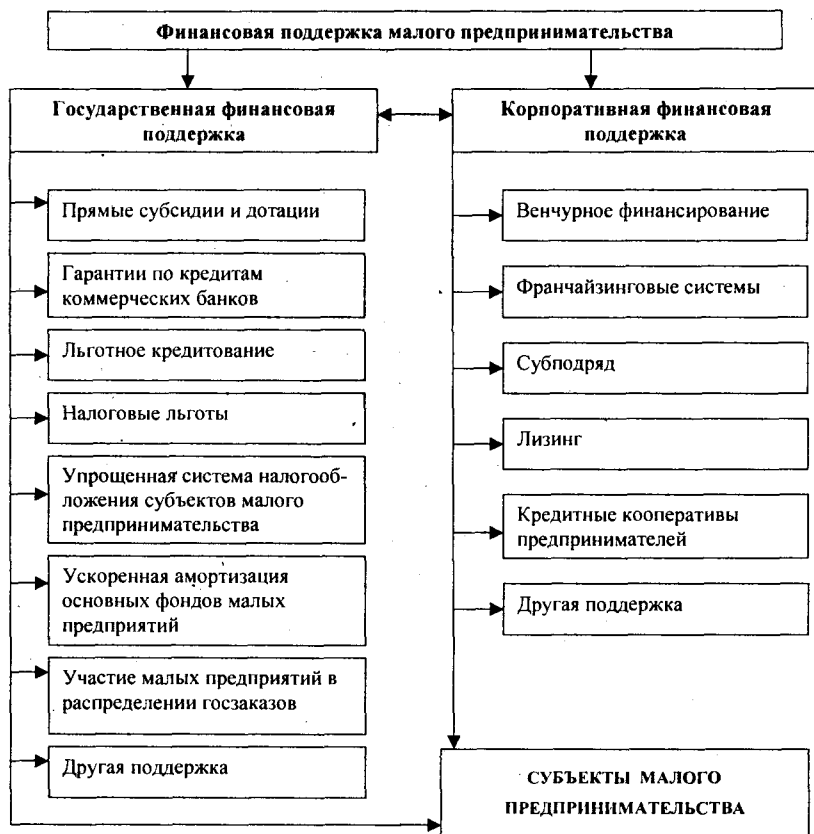
Рис. 1. Виды и методы финансовой поддержки малого предпринимательства

Важнейшим из традиционных инструментов государственной поддержки малого предпринимательства выступает механизм его финансовой поддержки. В настоящее время для успешного привлечения финансовых средств в сферу малого предпринимательства необходимы финансовые инструменты и методы поддержки предпринимательства, соответствующие мировой практике, но при этом адаптированные к российским условиям.