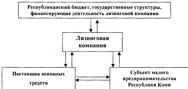
Рис. 4. Схема лизинговой сделки без привлечения кредитных структур для финансирования деятельности лизинговой компании