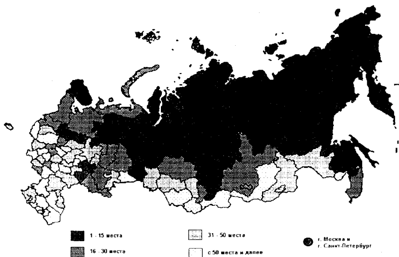
Рис.3. Группировка регионов Российской Федерации по убыванию валового регионального продукта на душу населения в 1999 году

Конечное потребление в домашних хозяйствах было в 1999 году наибольшим в Центральном федеральном округе (29229,3 рублей), в 1,6 раза превышающим среднероссийский уровень, в то время как по производству валового регионального продукта на душу населения Центральный округ находился на третьем месте. В занимавшем первое место по этому показателю Уральском ок-