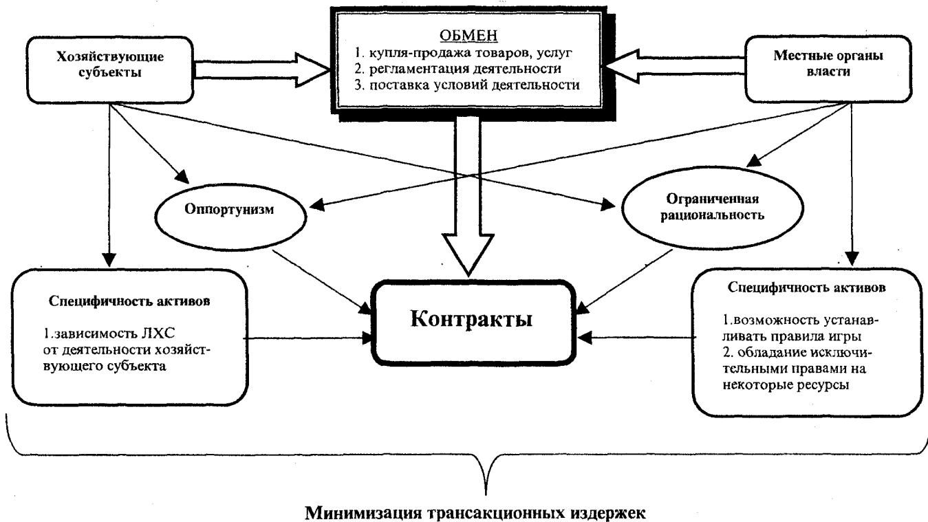
Рис. 4. Схема контрактных отношений местных органов власти и хозяйствующих субъектов