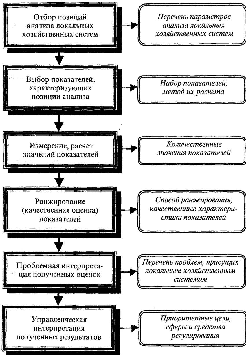
Рис. 2. Схема определения приоритетов регулирования взаимоотношений местных органов власти и хозяйствующих субъектов