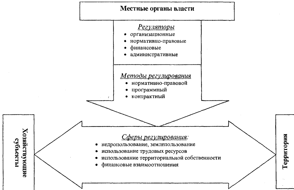
Рис. 1. Схема регулирования взаимоотношений местных органов власти и хозяйствующих субъектов