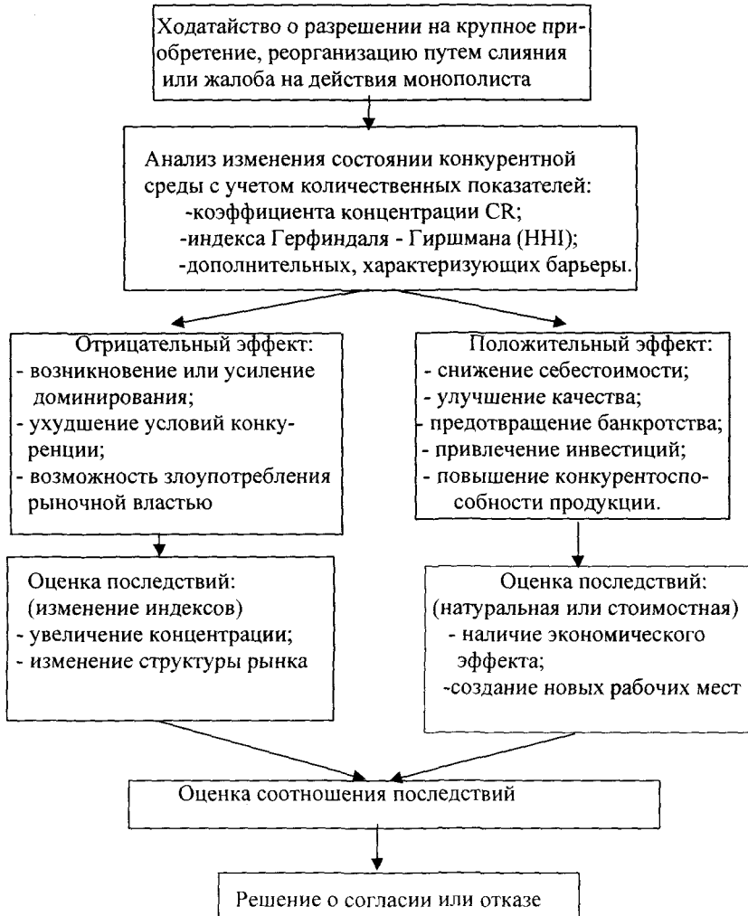
Рис. 2. Схема оценки интеграционных процессов

Преодоление монополизма перерабатывающих предприятий может быть осуществлено в рамках интеграционных преобразований с участием сельхозпроизводителей. Процесс формирования интегрированных структур, проводится с учетом оценки по предлагаемой методике последствий интеграционных процессов (рис.2).