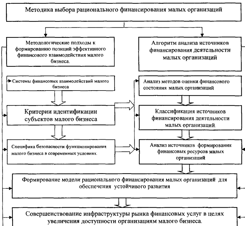
Рис. 2. Методика выбора рационального финансирования малых организаций.

совершенствования инфраструктуры рынка финансовых услуг в целях увеличения доступности организациям малого бизнеса (рис. 2).