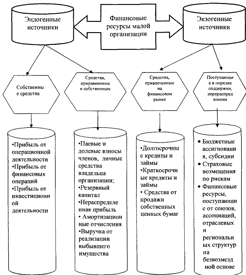
Рис. 1. Источники формирования финансовых ресурсов малых организаций

Предложенная классификация источников финансирования деятельности организаций учитывает специфические особенности финансового обеспечения малых организаций. Для правильной организации финансирования предпринимательской деятельности следует адекватно