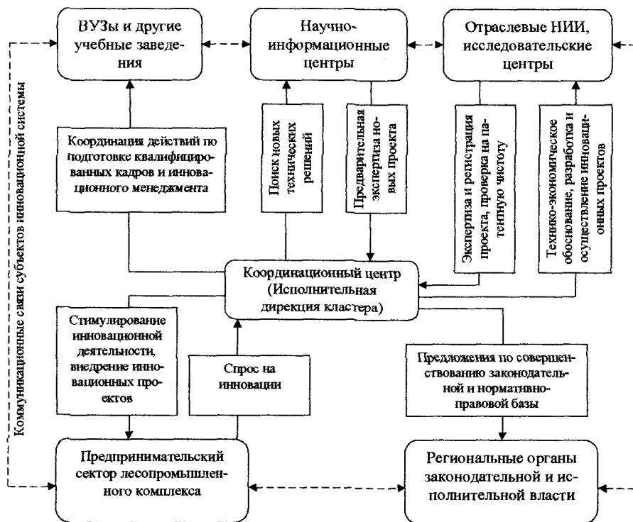
Рис. 5. Состав и взаимосвязи инновационной системы лесного кластера региона

Для достижения генеральной цели инновационной политики необходимо формирование на региональном уровне самодостаточной, целостной, способной к воспроизводству и саморазвитию инновационной системы, под которой понимается комплекс организаций, осуществляющих процессы создания и коммерциализации результатов научно-исследовательских и опытно-конструкторских работ (НИОКР). Координационный центр, в качестве которого выступает исполнительная дирекция кластера, является организующим, регулирующим и контролирующим органом, способствующим активизации инновационной деятельности. Она представляет ядро инновационной системы лесного кластера региона (рис. 5).