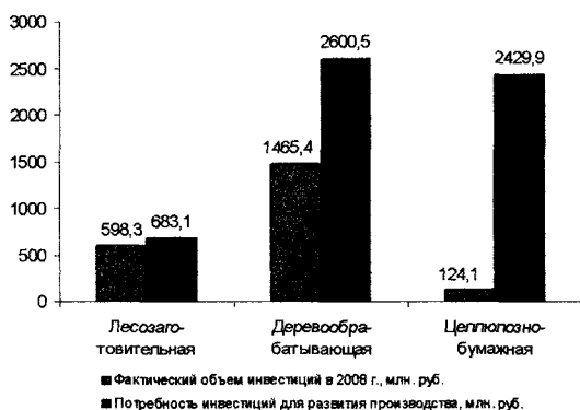
Рис. 2. Соотношение фактического и потребного объемов инвестиций по отраслям лесопромышленного комплекса Вологодской области (по результатам апробации методики)

При проектном уровне производства рентабельность в ЛПК увеличится почти в 3 раза и составит 15,5%, производительность труда и заработная плата увеличатся на 57 и 45% соответственно. Бюджетная и социальная эффективности возрастут к базовому году в 1,9 и 1,4 раза соответственно. Товарность одного куб. метра древесины в круглом виде увеличится на 23% – до 2356,9 руб. Повысится конкурентоспособность лесопромышленного комплекса (табл. 3).