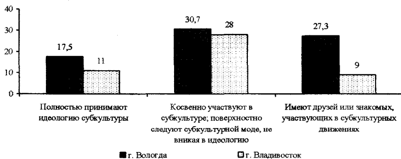
Рис. 1. Характеристика распространения субкультур среди студентов г. Вологды и г. Владивостока (в % от числа опрошенных)*

Сравнительный анализ показал, что в г. Вологде степень увлеченности студентов субкультурными движениями выше, чем в г. Владивостоке (рис. 1). Среди вологодских студентов больше доля тех, кто полностью вовлечен в субкультуру (18% против 11%), а также выше удельный вес тех, кто знаком с людьми, являющимися участниками субкультур (27% против 9%). Около 30% учащихся вузов следуют субкультурной моде поверхностно, не вникая в идеологию.