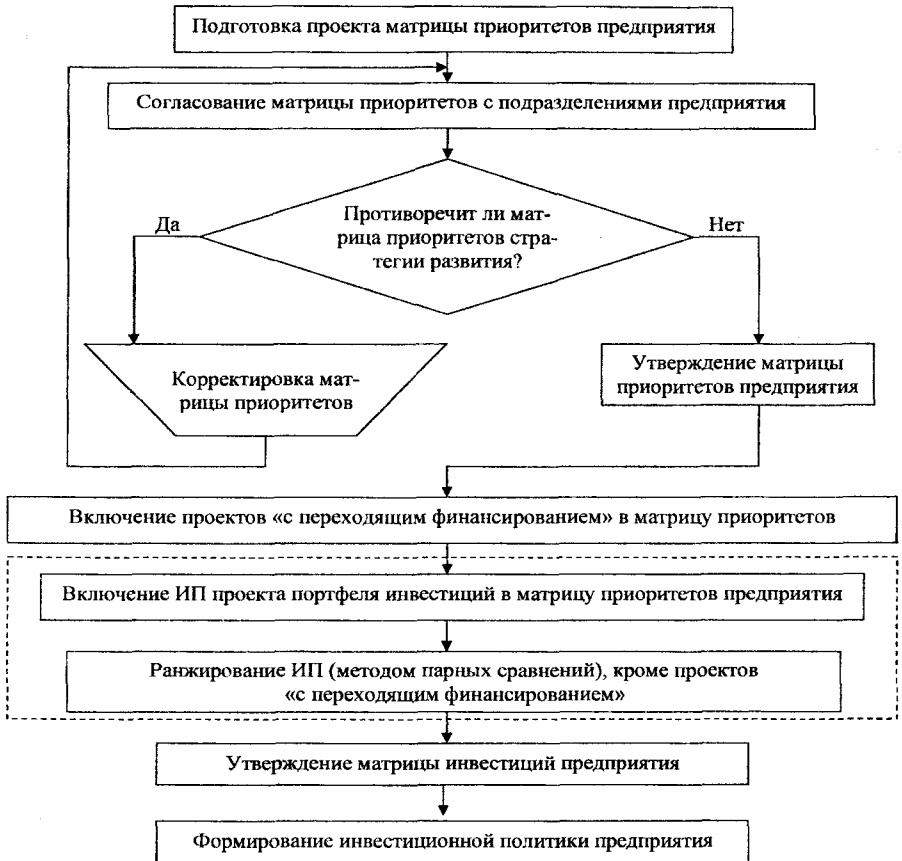
Рисунок 3 – Алгоритм ранжирования инвестиционных проектов на предприятии

осуществляющих финансирование (софинансирование) проектов, в реализации проекта.