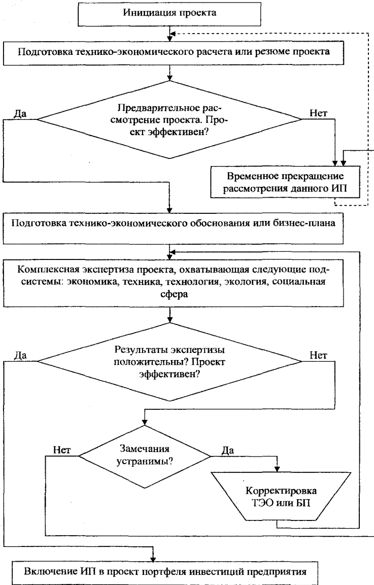
Рисунок 2 – Алгоритм оценки эффективности инвестиционных проектов на предприятии