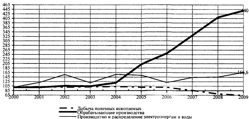
Рисунок 1. Индекс промышленного производства Республики Дагестан по отраслям (в % к 2000 году)

В структуре промышленного комплекса Республики Дагестан лидирующие позиции занимает машиностроение: на его долю приходится более 54% выпуска продукции, основу которого составляют производство электрооборудования (53% от выпуска машиностроения), строительство и ремонт судов (29%), производство летательных аппаратов (15%).