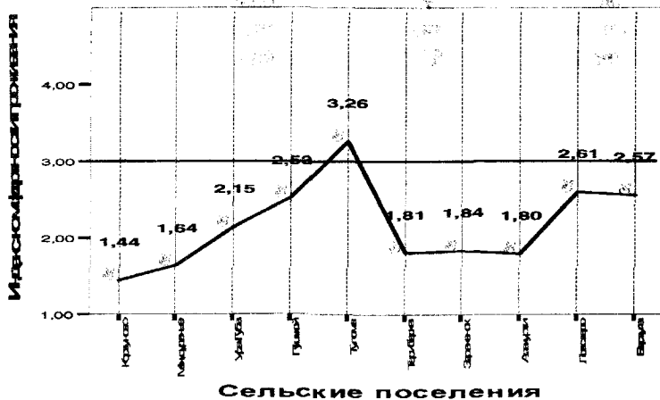
Рис. 2. Индекс комфортности проживания населения в сельских поселениях.