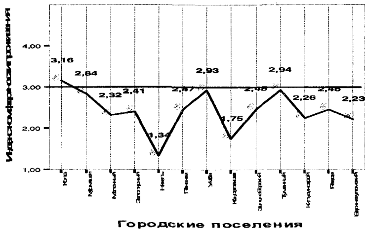
Рис. 3. Индекс комфортности проживания населения в городских поселениях.

Жилищно-коммунальное хозяйство региона недостаточно развито, и многие объекты требуют ремонта. Отсутствие капиталовложений в жилищное строительство, транспорт, водопроводное и водоотводное хозяйство, а также в очистные сооружения привело к тому, что жители считают состояние ЖКХ неудовлетворительным. Связанная с работами на