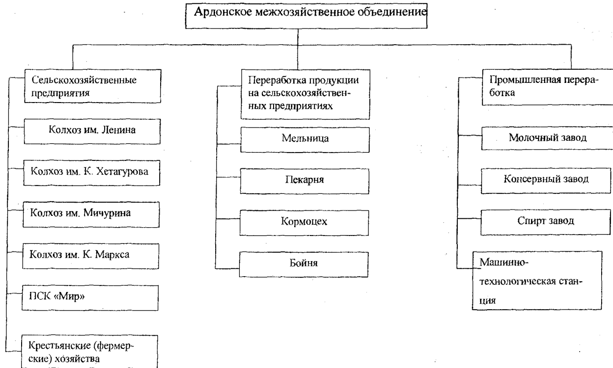
Рис. 2. Структура Ардонского межхозяйственного объединения.