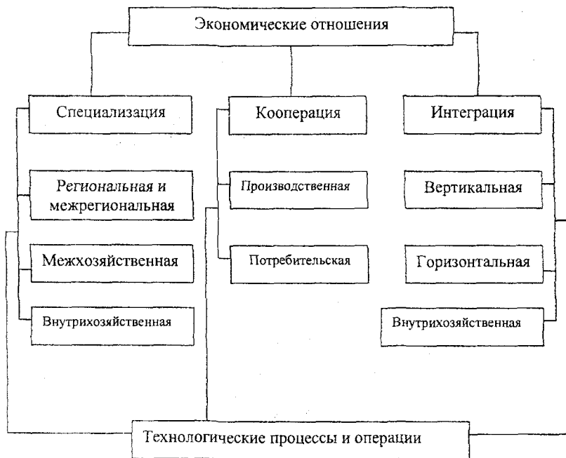
Рис. 1 Классификация процессов специализации, кооперации и интеграции производства.

теграция. Как специфическая форма выражения общественного разделения труда, она становится объективно необходимой на той стадии развития производительных сил, когда особо возрастает роль органической взаимосвязи между сельским хозяйством и перерабатывающей промышленностью. Этот процесс проявляется в следующих основных формах – вертикальной, горизонтальной, и внутрихозяйственной.