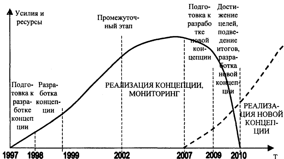
Рис. 1 Основные этапы жизненного цикла концепции