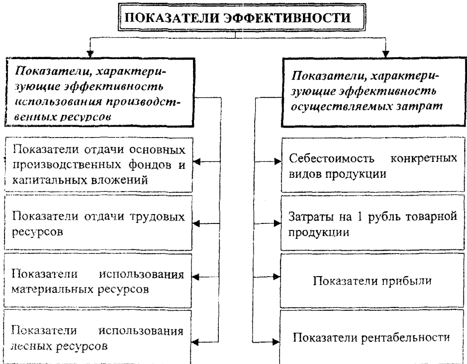
Рис. 1. Система показателей оценки эффективности производства на предприятиях лесопромышленного комплекса

Иначе говоря, в системе учитывается не только степень достижения цели деятельности предприятия, но и в какой мере полученные результаты способствуют достижению целей народного хозяйства в целом, и прежде всего экономического роста и повышения благосостояния населения. При определении экономической эффективности необходимо учитывать и экологические факторы.