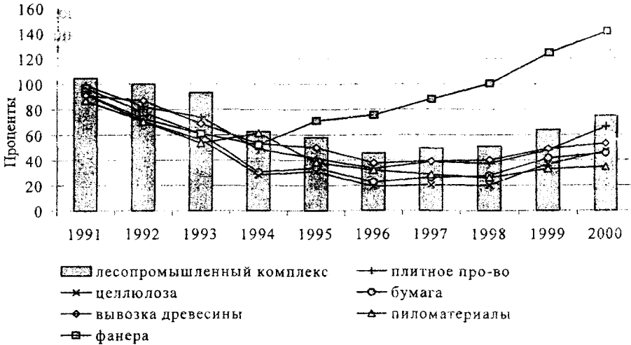
Рис. 2 Динамика производства основных видов продукции лесопромышленного комплекса в 1990–2000 гг. (в процентах к 1990 г.)

Анализ современного состояния предприятий ЛПК области в диссертации проведен в сравнении с состоянием предприятий до начала экономических преобразований, направленных на продвижение рыночных механизмов хозяйственного развития. Установлено, что за период реформирования использование потенциала ЛПК области имело тенденцию "падения" (рис.2).