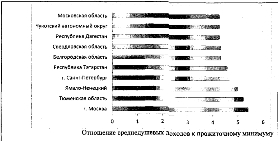
Рис. 1 – Отношение среднедушевых доходов четвертой доходной группы населения к прожиточному минимуму в субъектах РФ 2

К 10-ти регионам с наибольшим отношением среднедушевого дохода четвертой доходной группы населения, приближенно соответствующей среднему классу, к прожиточному минимуму в этих регионах относятся: г.Москва, Тверская область, Ямало-Ненецкий автономный округ, г.Санкт-Петербург, республика Татарстан, Белгородская область, Свердловская область, республика Дагестан, Чукотский автономный округ, Московская область (рисунок 1).