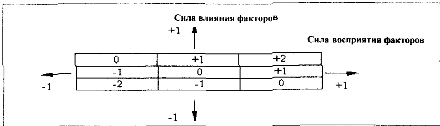
Рис. 3 – Матрица фазовых состояний экономического развития региона

Фазовое состояние устойчивости регионального экономического развития определим как сумму фаз влияния и восприимчивости. Получим следующую матрицу фазовых состояний (рисунок 3).