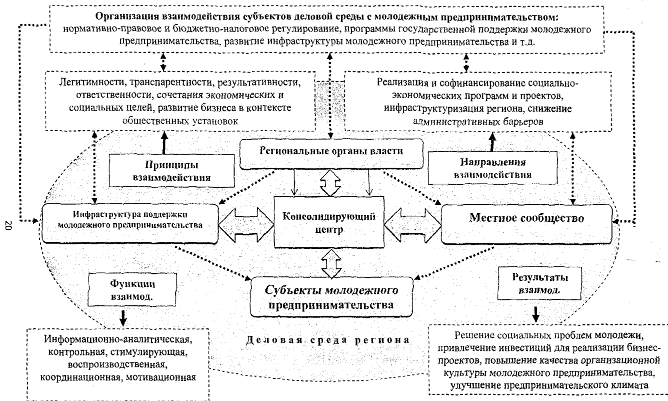
Рис. 3. Механизм взаимодействия элементов системы развития молодежного предпринимательства в деловой среде региона