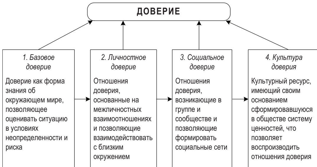
Рис. 1. Структура доверия

Рассматривая доверие как сложный по своей структуре феномен, мы можем представить его структуру как многоуровневое образование (рис. 1). В ней можно выделить базовый уровень, содержащий в себе представления об окружающем мире. Базовый уровень позволяет субъекту воспринимать окружающую действительность, ориентироваться в ней, оценивать риски окружающей среды. Полученные в процессе социализации знания становятся основой формирования межличностного уровня доверия. Данный уровень предстает в форме субъект-субъектных отношений. Здесь продолжается освоение информации о мире, осваиваются роли доверяющего и доверяемого. Социальный уровень включает в себя отношения доверия, формирующиеся в рамках группы или сообщества. Именно этот уровень доверия способствует формированию социальных сетей. И наконец, культура доверия как ресурс, основанный на сложившейся системе ценностей и норм, которая и дает возможность воспроизводить отношения доверия.