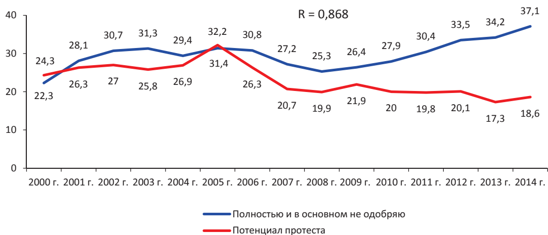
Рис. 3. Потенциал протеста и доля населения, негативно оценивающего деятельность региональных и местных властей (губернатор, Законодательное Собрание области, главы муниципальных образований, советы местного самоуправления; в % от числа опрошенных)

Сопоставление данных регулярного мониторинга позволяет сравнить уровень потенциальной протестной активности жителей округа с различными оценками социально-политической обстановки и деятельности властных структур.