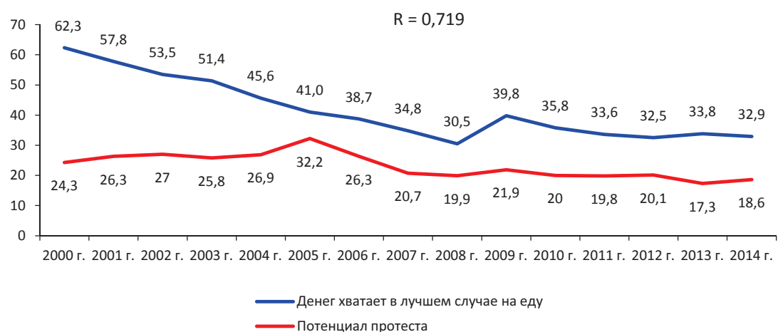
Рис. 7. Потенциал протеста и доля населения с низким уровнем покупательной способности доходов (в % от числа опрошенных)