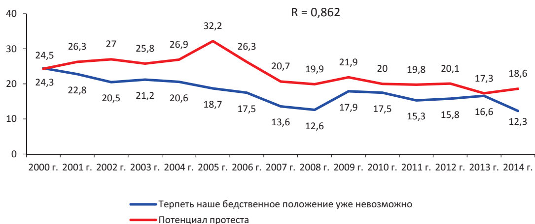
Рис. 4. Потенциал протеста и доля населения с низким уровнем запаса социального терпения (в % от числа опрошенных)

Вторая группа факторов, показавшая тесную связь с уровнем потенциала протеста, относится к социальному самочувствию жителей области (рис. 4 и 5). Низкий уровень запаса терпения, характерный в среднем за рассматриваемый период для четверти населения, и негативное эмоциональное состояние, которым отличается около 40% населения, являются важными составляющими потенциального социального протеста. Коэффициент корреляции протестных настроений с данными индикаторами составил за период измерений в среднем 0,8.