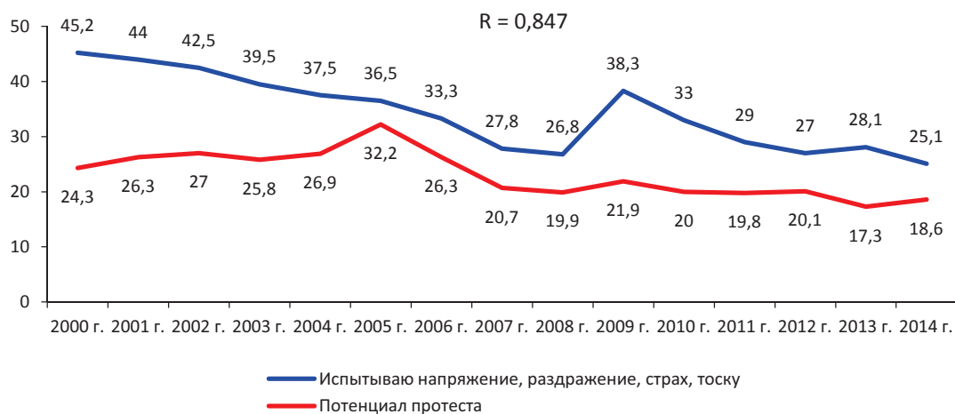
Рис. 5. Потенциал протеста и доля населения с негативными оценками социального настроения (в % от числа опрошенных)