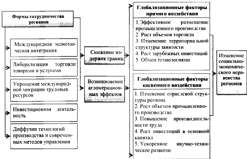
Рис. 1. Схема основных направлений факторного воздействия глобализации на социально-экономическое неравенство регионов (сост. авт.)

Автором была сформулирована теоретическая модель влияния глобализационных процессов на социально-экономическое неравенство регионов.