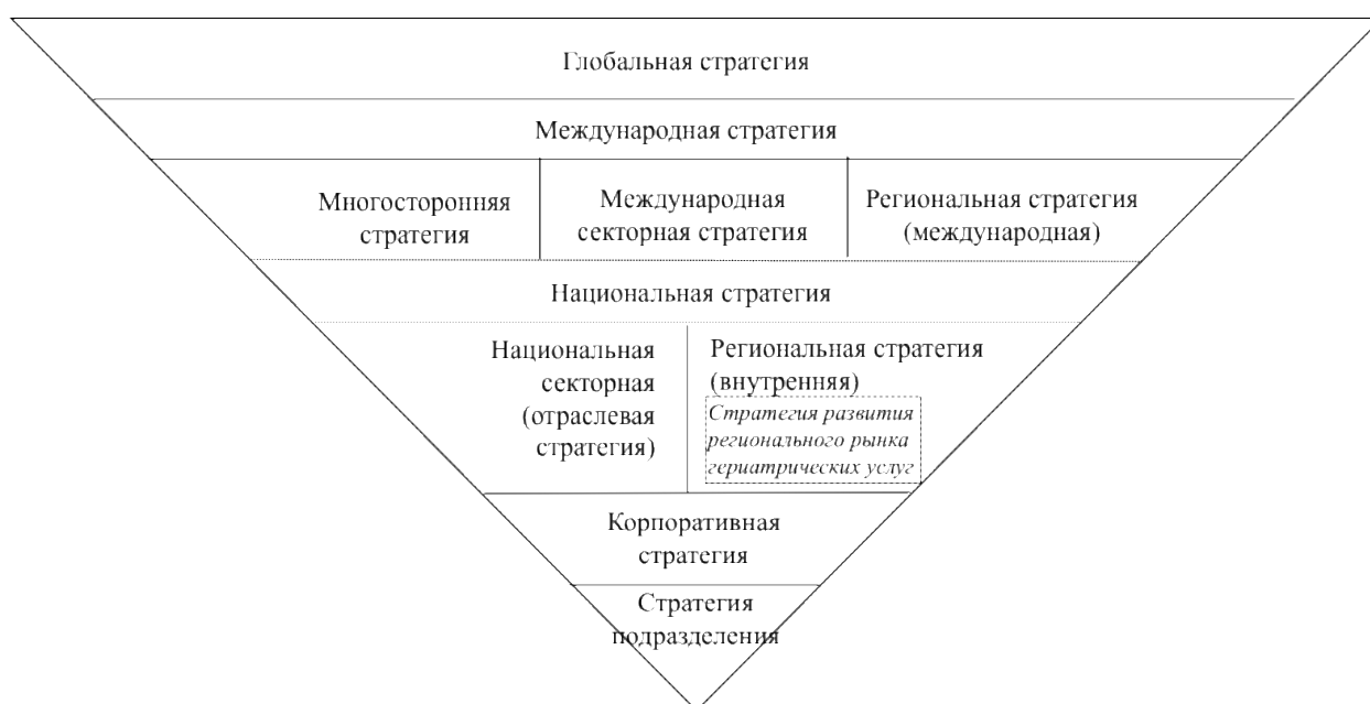
Рис. 1. Система стратегии.

Стратегия развития регионального рынка гериатрических услуг имеет взаимосвязь с глобальными, международными, а также национальными стратегиями в данной сфере. Она должна базироваться на основных принципах, которые обеспечат ее успешную реализацию.