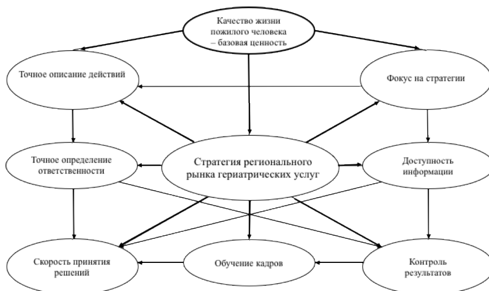
Рис. 2. Элементы разработки и реализации стратегии развития регионального рынка гериатрических услуг.