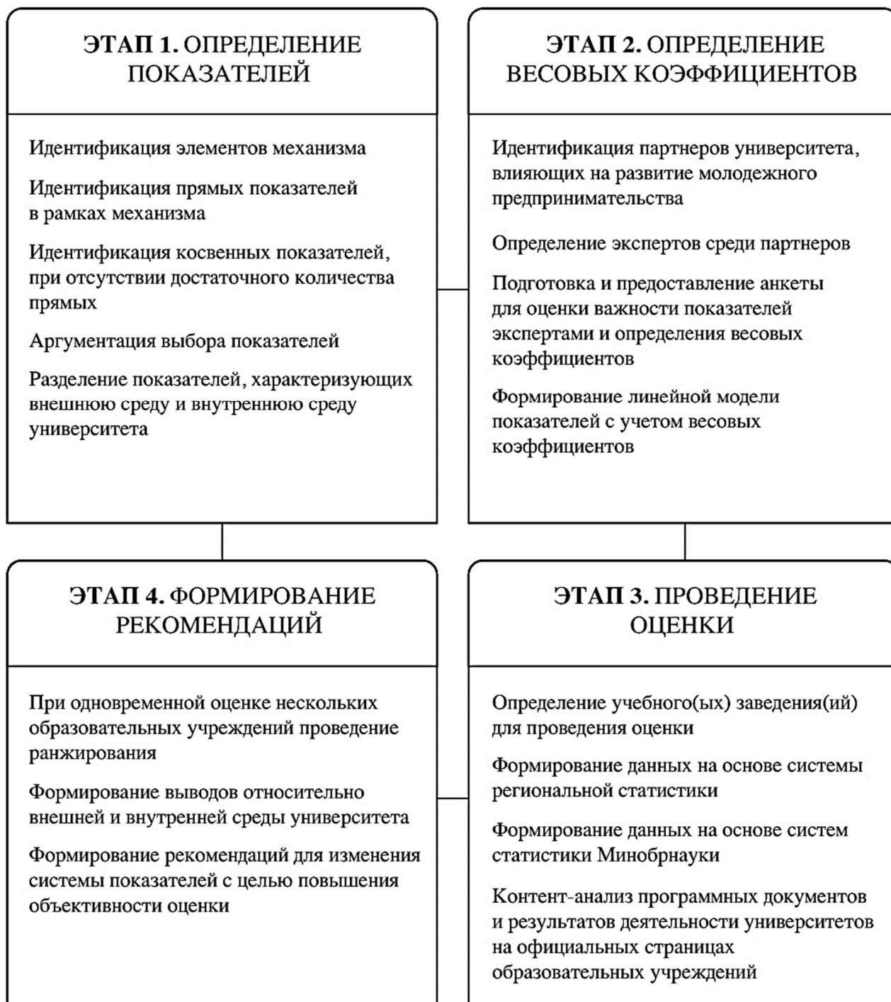
Рисунок 1 – Этапы оценки развития молодежного предпринимательства в университете

Оценка региональных показателей, влияющих на развитие молодежного предпринимательства, производится по следующей формуле: